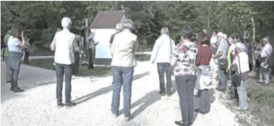
(Maiandacht an der Zuylenkapelle)

Allen sei an dieser Stelle herzlich gedankt, die den Marienmonat in dieser traditionellen Feierform begehen, sich die Gottesmutter zum Vorbild nehmen und auf ihre Fürsprache die Anliegen dieser Welt und Zeit vor Gott tragen.